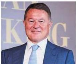
Giuseppe Marino MB Associati