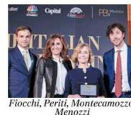
Fiochi, Periti, Montecamozzo, Menozzi Fantozzi & Associati