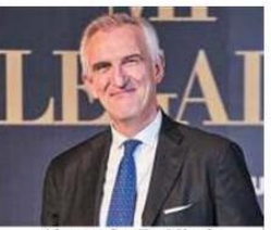
Alessandro De Nicola Orrick Herrington & Sutcliffe