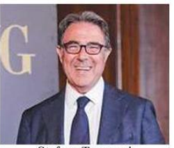
Stefano Tronconi Pirola Pennuto Zei & Associati