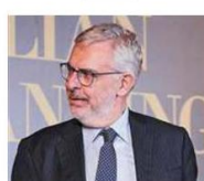
Enrico Castellani Greshfields Bruckhaus Deringer