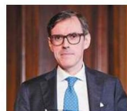
Denis Bonvegna Curtis Mallet-Prevost Colt & Mosle