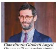
Gianvittorio Giroletti Angeli Giovannelli e associati studio legale