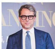
Gerardo Gabrielli Gattai Minoli Partners