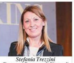
Stefania Trezzini Tremonti Romagnoli Piccardi e Associati