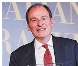
Roberto della Vecchia Di Tanno Associati