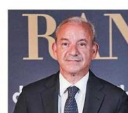
Filippo Arena Gatti Pavesi Bianchi Ludovici