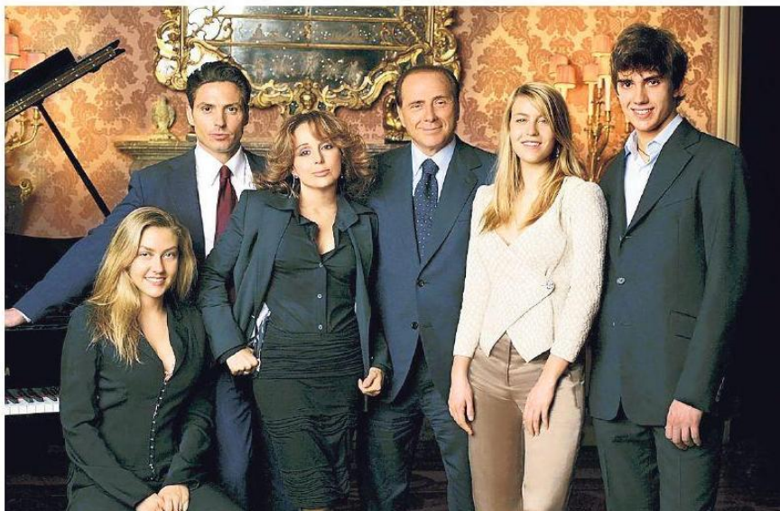
Foto di famiglia. Silvio Berlusconi con tutti i suoi figli: Eleonora, Pier Silvio, Marina, Barbara e Luigi